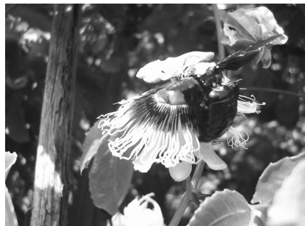
Figura 2: Atividade de abelha mangangá ( Xylocopa frontalis ) visitando flor de maracujá em cultivo na comunidade de Gameleira.

to. Segundo os entrevistados, as flores do maracujá que são “beijadas” pelo mangangá são as que vão produzir frutos (Figura 2).