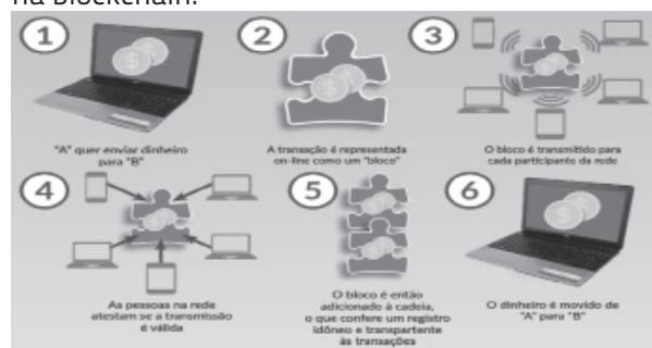
Figura 2. O funcionamento de uma moeda digital na blockchain.

Assim, o Bitcoin se tornou uma moeda digital e sistema de pagamentos on-line, onde por meio de técnicas de criptografia, fundos podem ser transferidos sem a necessidade de depender de bancos centrais, pois o processo de confirmação de transações precisa do poder computacional de outros usuários da rede para o consenso e registro da transação no blockchain (LIN e LIAO, 2017). Conforme exemplificado na Figura 2.