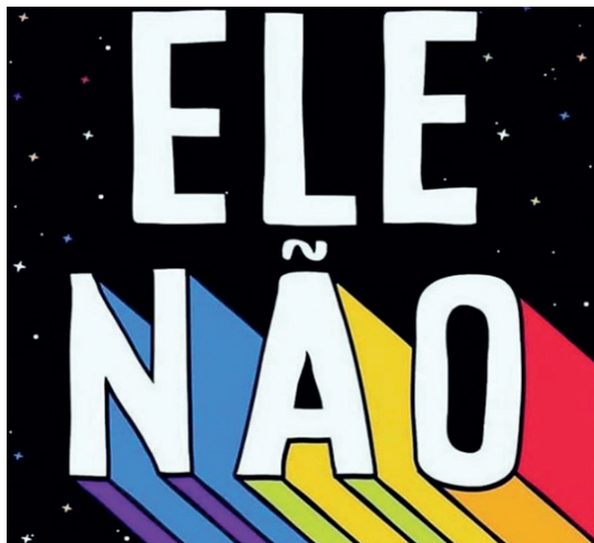
Figura 1 – Cartaz digital “Ele Não”