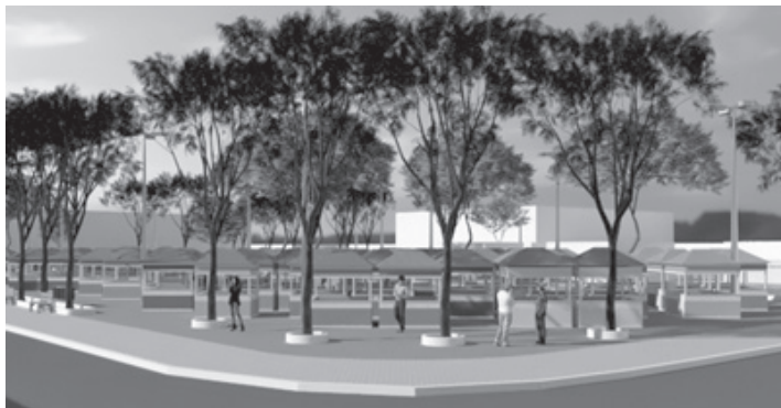
Figura 4 – Barracas da Feirinha de Artesanato Guerreiros da Arte

A Estação elevatória de esgoto foi mantida no local e contornada com vegetação, as barracas da Feirinha de Artesanato Guerreiros da Arte também permaneceram na mesma área, sendo reorganizadas de acordo com o espaço, vegetação e impacto visual. As áreas de estar, convívio e contemplação foram inseridas na parte de maior visibilidade da praça, que compreende a vista para a praia e por onde ocorre o acesso principal. As áreas de lazer ativo que abrangem as atividades mais matinais foram inseridas no oeste, juntamente com a área de estacionamento destinado aos veículos e bicicletas. Assim, os demais espaços foram destinados às áreas de circulação dos pedestres.