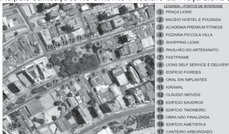
Figura 2 – Principais edificações no entorno imediato da Praça Lions (sem escala)