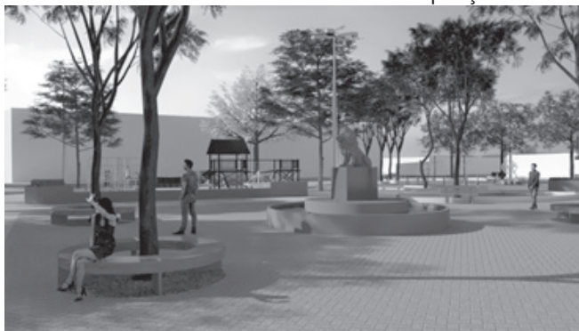
Figura 5 – Estátua do Leão na área de estar e contemplação

almente a praça com o contexto urbano. Além disso, proporcionar um projeto que permita uma boa mobilidade e acessibilidade em todos os setores, com atividades que atendam a diferentes faixas etárias e possibilitem a conexão entre elas.