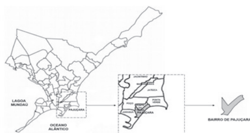
Figura 1 – Localização do bairro de Pajuçara na cidade de Maceió