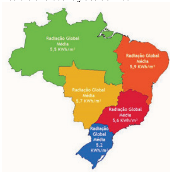
Figura 1 – Radiação média diária das regiões do Brasil