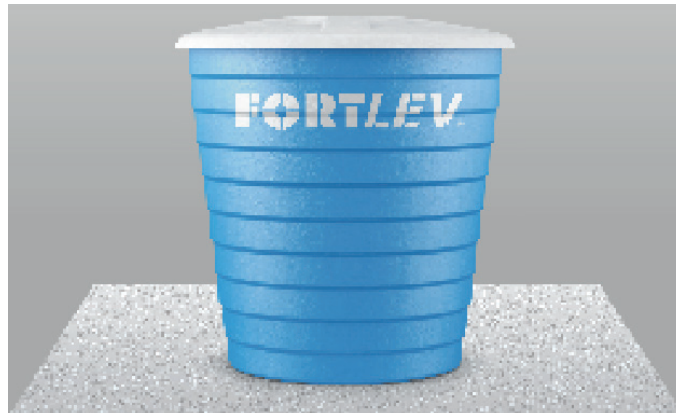
Figura 4 – Caixa d'água devidamente assentada

De acordo com catálogo técnico da FORTLEV (2010) uma caixa d'água não deve ser enterrada, não deve ser assentada diretamente sobre o solo, não deve ser instalada sobre terreno arenoso, nem terreno desnivelado e sem a utilização de base de cruzetas e base gradeada. A caixa d'água para ser instalada corretamente (FIGURA 4) deve ser assentada sobre uma base feita em concreto, ajustada sobre uma superfície plana e segura.