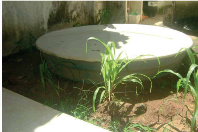
Figura 3 – Reservatório inferior da USF-Reginaldo

A agente comunitária entrevistada trabalhava na USF-Reginaldo há 15 anos, tendo como responsável pelo local a Secretaria de Saúde. A equipe de médicos, enfermeiras, agentes e auxiliares utiliza a água para lavar as mãos e esterilizar o material de uso clínico. A utilização do banheiro é imprópria, além disso, segundo a agente, a água do reservatório inferior (FIGURA 3) provavelmente está contaminada por não ter sido feita a devida instalação.