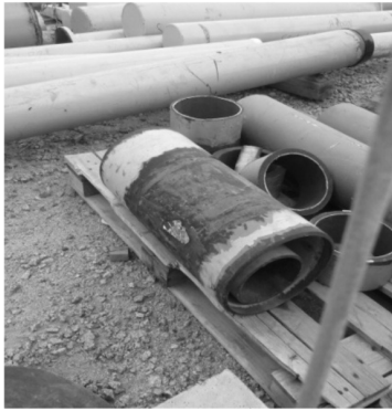
Figura 1 – Princípio de corrosão em tubo exposto ao intemperismo