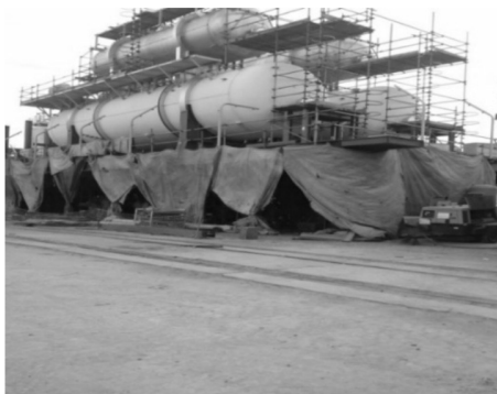
Figura 2 – Processo de jateamento, utilizando lonas para evitar a contaminação com o solo.

Quando as peças são soldadas e ganham forma, elas passam por um processo de jateamento de um material de coloração escura, muito parecido com o xisto do petróleo. Para que esse processo possa ser feito, é colocado sobre as peças lonas para que o jateamento seja feito com perfeição, como mostra a Figura 2: