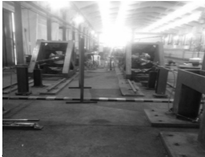
Figura 4 – Máquinas que realizam o processo de proteção interna nas tubulações

Como o petróleo não é totalmente puro na fase de exploração do poço, as empresas que fazem a fabricação das tubulações, fazem um revestimento interno de liga de cobre e níquel, que serve como inibidor interno das tubulações. Muito tempo é gasto para se fazer um revestimento desse tipo. Por exemplo, em um tubo de oito metros, são gastas dez horas para que o revestimento seja totalmente finalizado. Como mostra a Figura 4: