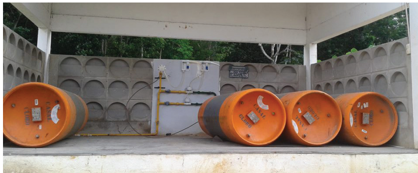
Figura 4 – Cloro utilizado no Sistema Catolé Cardoso