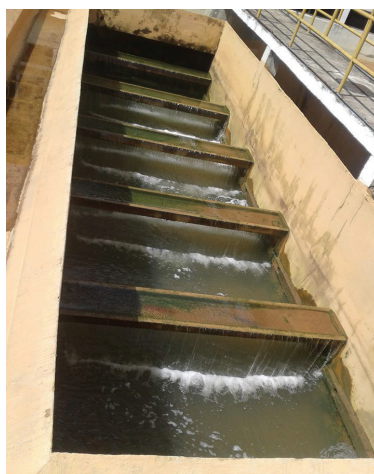
Figura 5 – Processo de Decantação realizado no Sistema Pratagy