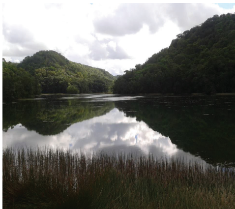
Figura 1 – APA do Catolé