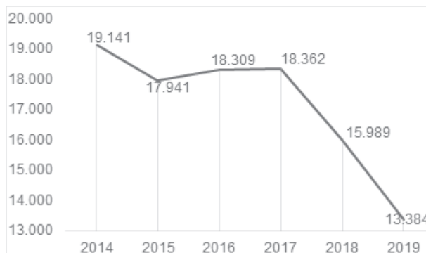
Figura 1 – Total de óbitos de adolescentes por causas externas no Brasil entre os anos de 2014 a 2019