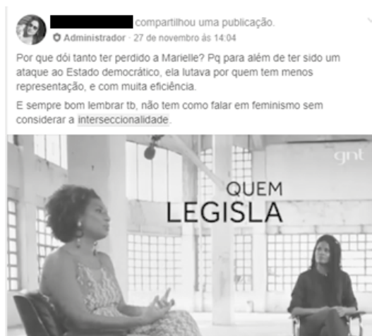
Figura 7 – Grupo de Facebook Mujeres por la Democracia! – Interseccionalidad