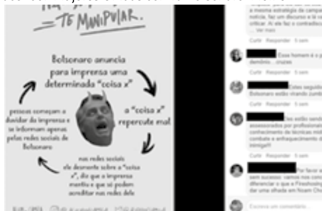
Figura 6 – Grupo de Facebook Mujeres Unidas contra Bolsonaro: Meme