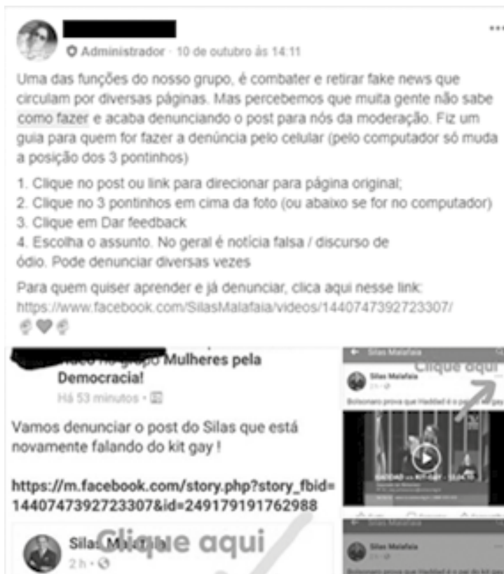
Figura 4 – Grupo del Facebook Mujeres por la Democracia: Fake News