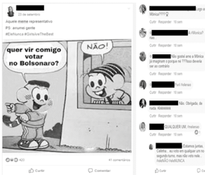
Figura 5 a.b – Grupo de Facebook Mujeres Unidas contra Bolsonaro: Meme