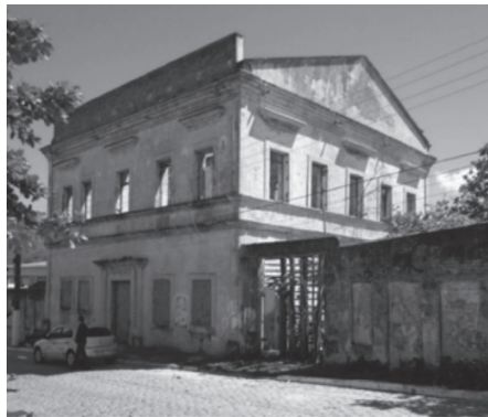
Figura 5 – Foto da Casa de Câmara e Cadeia de Mata Grande, em sua atual situação. Na foto é possível observar as suas fachadas e detalhes ornamentais