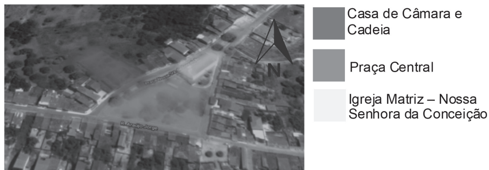
Figura 3 – Localização da Casa de Câmara e Cadeia, junto a Igreja Matriz e a Praça Central do município

“Em que se pese a importância da Casa de Câmara e Cadeia, a ponto de não ser possível efetuar qualquer estudo de história urbana sem lhe fazer referência” (TEIXEIRA, 2012, p. 19). Mata Grande, é um bom exemplo disso, visto que o imponente prédio, está posicionado na parte mais alta e magnífica da cidade, e na parte central, junto à igreja e defronte à praça principal do município. Pode-se se dizer então que, prédio era um dos principais monumentos da paisagem urbana, sua importância ia além da administrativa.