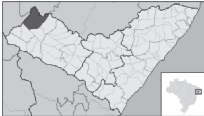
Figura 1 – Mapa de localização do Município no estado de Alagoas, no extremo noroeste já fazendo divisa com o estado de Pernambuco