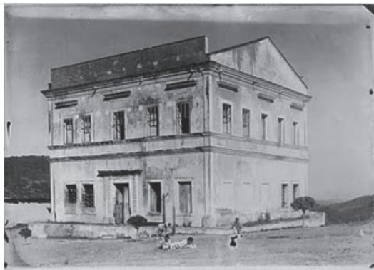
Figura 4 – Foto da Casa de Câmara e Cadeia de Mata Grande, demonstrando suas várias características neoclássicas

As características desse estilo nada mais eram do que uma versão provinciana, simplificada (muitas vezes feito por escravos não preparados para esse tipo de construção, como é caso do prédio em destaque) do que era chamado de Neoclássico, estilo introduzido no país pelos europeus, marcada pela emulação de formas greco-romanas como triangulares, platibandas, vergas retas e outros.