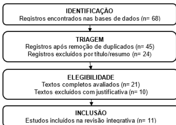
Figura 1 – Fluxograma PRISMA adaptado para ilustrar as etapas de identificação, triagem, elegibilidade e inclusão dos estudos na revisão integrativa

logia, sociologia e saúde coletiva, afim de compreender de forma mais integral as experiências subjetivas e contextuais dos adolescentes em vulnerabilidade. Assim, a revisão não apenas sistematiza dados, mas propõe um olhar crítico sobre os limites e potencialidades das evidências disponíveis, contribuindo para novas direções investigativas e práticas de intervenção social (Da Nóbrega et al. , 2020).